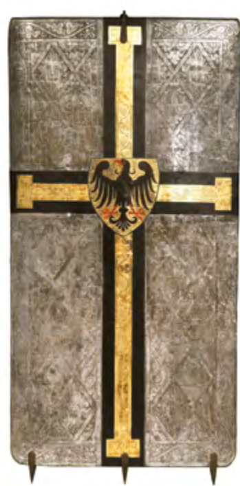
Ryc. 6 Tarcza oblężnicza z herbem wielkiego mistrza – awers