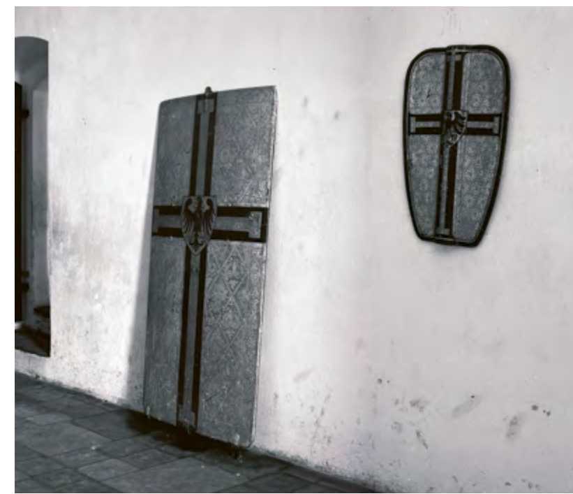
Ryc. 8 Fragment wystawy Dzieje Zamku i Ziemi Malborskiej w 1961 roku

Omawiając ten przedmiot warto pochylić się nad terminem, którym powinno się go określać. Podobnie jak inne weksylia wykonywane do celów dekoracyjnych malborskiego zamku, również i to nosiło średniowieczne godło. Znaki bojowe z okresu średniowiecza nazywano chorągwiami. Miały one jednak inną formę niż te, które zdobiły malborski zamek. Ich wygląd jest nam dobrze znany dzięki dziełu Banderia Prutenorum Jana Długosza, w którym opisano oraz zilustrowano 56 chorągwi krzyżackich, w tym dwie należące do wielkiego mistrza. Obie były w całości malowane, miały formę prostokąta, o wymiarach 134×185 cm (chorągiew większa) oraz 58×78 cm (chorągiew gończa), pozbawione były obszycia na krawędziach, a godła skierowane były ku drzewcu 10 . Z tego też względu omawianego zabytku nie można nazwać kopią chorągwi wielkiego mistrza. Tworząc dekoracyjne weksylia, pruscy konserwatorzy zdecydowali się nadać im formę współczesnego znaku oddziału wojskowego, jakim był sztandar. Dowodzą tego Sprawozdania Zarządu Towarzystwa Odbudowy i Upiększania Zamku Malborskiego , gdzie określone są one mianem Standarte 11 . Słowo to pojawiło się w XVIII wieku na określenie znaku bojowego jazdy. Sztandary mają bardziej ujednoliczoną formę, która przybiera postać płata (najczęściej kwadratowego) wykonanego z dwóch zszytych ze sobą tkanin, obszytego na brzegach frędzlami oraz przybitego jednym bokiem do drzewca 12 .