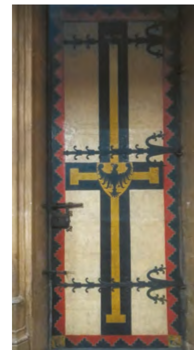
Ryc. 11 Drzwi w katedrze św. Elżbiety w Marburgu