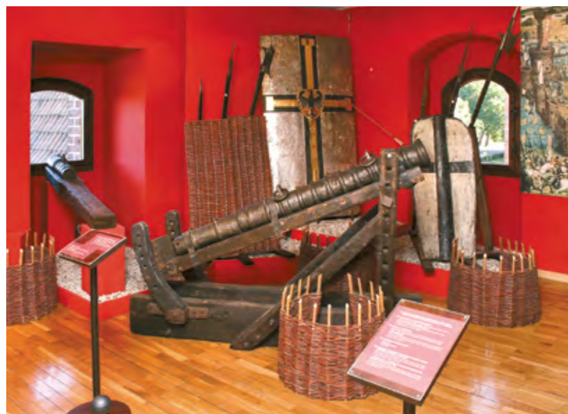
Ryc. 9 Fragment wystawy w 2001 roku Broń i barwa w czasach krzyżackich od XIII do połowy XVI wieku

później była eksponowana na pierwszej stałej wystawie nowo utworzonego Muzeum Zamkowego w Malborku pt. Dzieje Zamku i Ziemi Malborskiej . Pokazywano ją w latach 1961–1963 na pierwszym piętrze Pałacu Wielkich Mistrzów w pomieszczeniu określanym jako garderoba wielkiego mistrza (Ryc. 8) 19 . Określana była jako „tarcza typu ciężkiego z xv w. rekonstrukcja” 20 . Po zakończeniu wystawy, ze względu na stan zachowania tarczy przeniesiono ją do magazynu, gdzie przeleżała do 2001 roku, kiedy to wyeksponowano ją ponownie, tym razem na nowej, stałej wystawie militariów, zatytułowanej Broń i barwa w czasach krzyżackich od XIII do połowy XVI wieku (Ryc. 9), która prezentowana była na podstryszach części południowej skrzydła wschodniego na Zamku Średnim. Dopiero wtedy wpisano ją do inwentarza militariów pod numerem MZM/Mt/642. W 2014 roku poddano ją konserwacji, której podjęła się Monika Filar-Maksymowicz 21 . W maju 2016 roku tarcza stała się częścią nowej wystawy militariów pt. Oreż europejski od XI do XIX wieku , na której oglądać ją można do dziś.