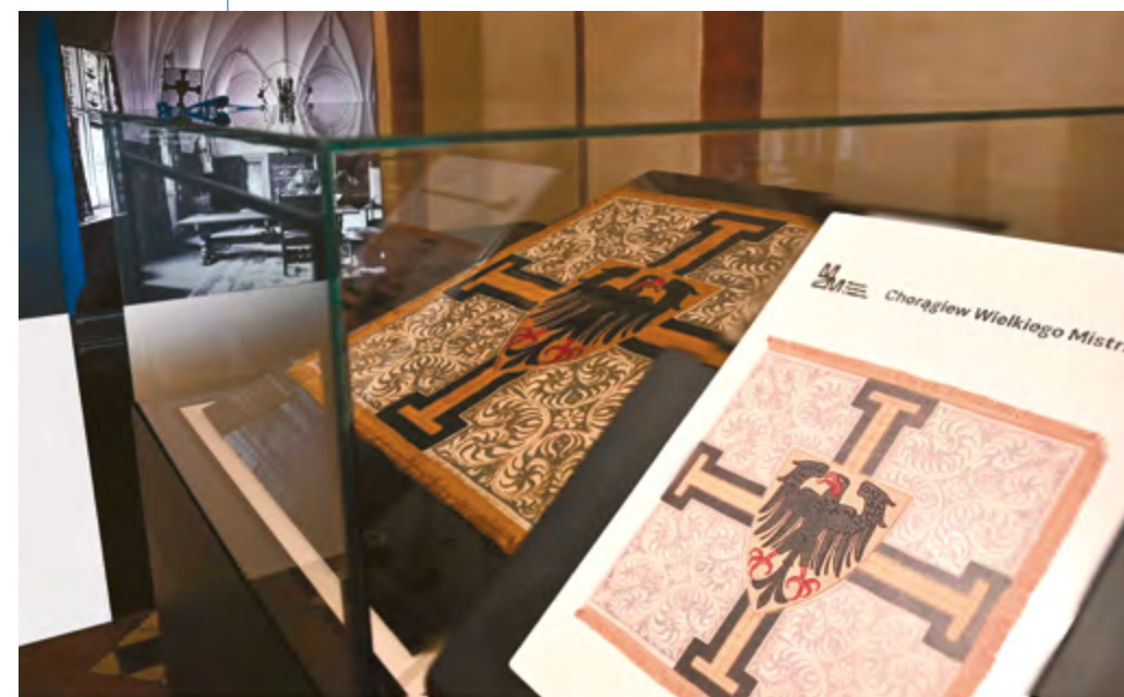
Ryc. 5 Ekspozycja sztandaru na wystawie Nigra crux, mala crux