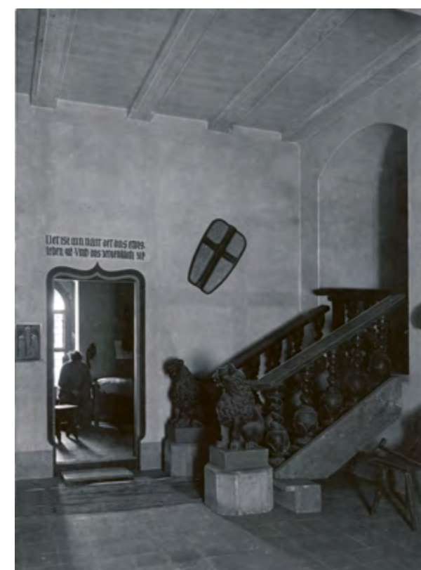
Ryc. 15 Infirmaria w 1918 roku, źródło: MBj. 1918, s. 12