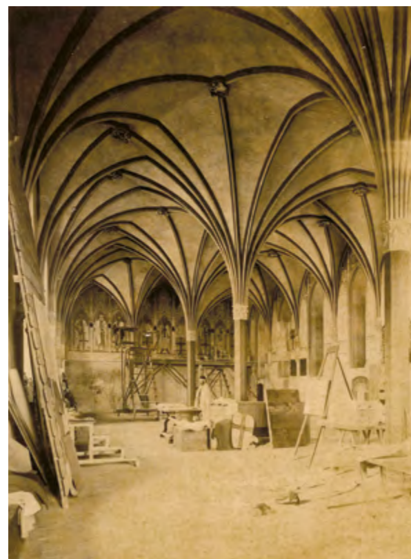
Ryc. 14 Kapitularz na Zamku Wysokim w 1894 roku, źródło: MBj. 1894, s. 29