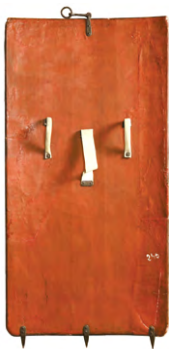
Ryc. 7 Tarcza oblężnicza – rewers

doczepiona była za pomocą dwóch pierścieni do długiego na około 3,5 metra drzewca zwieńczonego grotem.