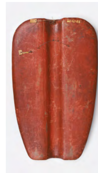
Ryc. 13 Pawęż z herbem wielkiego mistrza – rewers