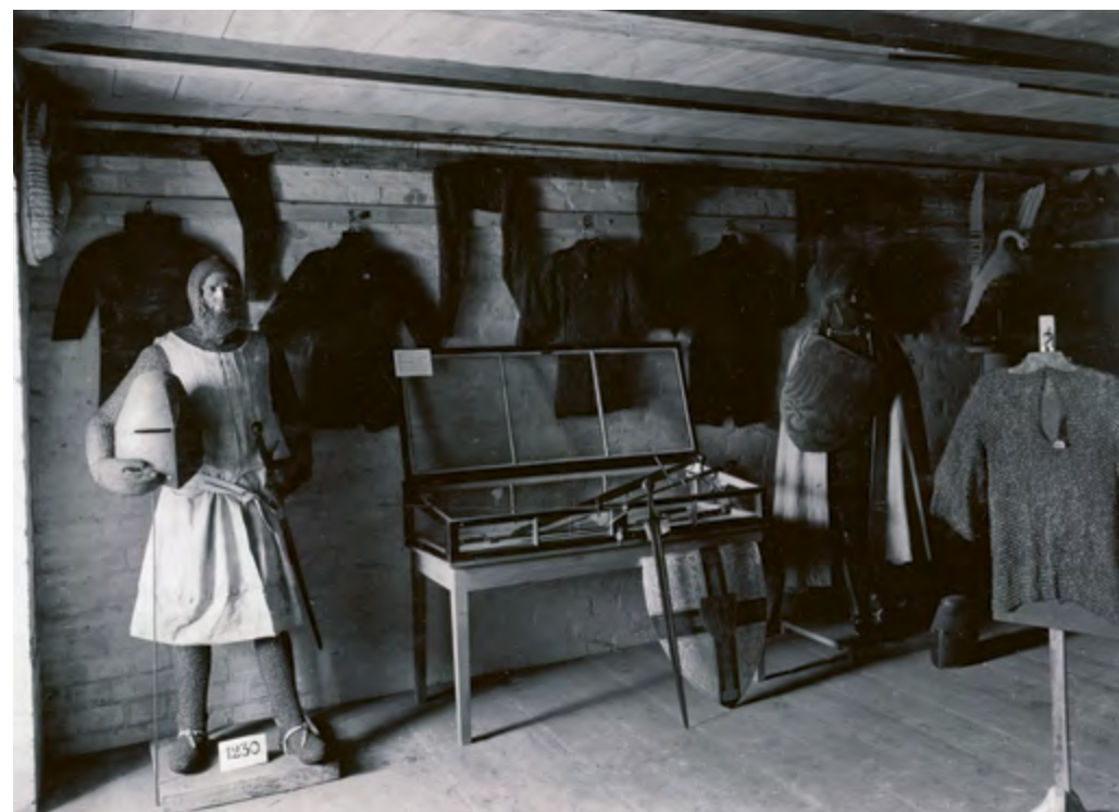
Ryc. 18 Podstrysze infirmerii w 1917 roku

i pomalowane srebrną farbą. Od strony wewnętrznej tarcza pomalowana jest na brązowo. Przybito do niej cztery uchwyty, z których zachowały się tylko dwa. W górnym, lewym narożniku przybito stalową obręcz do zawieszenia tarczy na ścianie. Na rewersie tarczy znajdują się dwa numery: na dole, w części centralnej namalowano czerwoną farbą numer inwentarzowy z Muzeum Wojska Polskiego (W.51285 MWP), zaś w górnym, lewym narożniku naklejono numer z kolekcji Blella – 866. Wysokość tego zabytku to 675 mm, szerokość maksymalna 585 mm, natomiast grubość 15 mm.