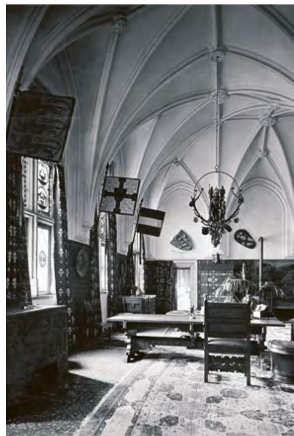
Ryc. 3 Zimowy refektarz w 1902 roku