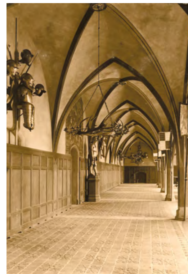
Ryc. 4 Sala siedmiofilarowa w 1917 roku