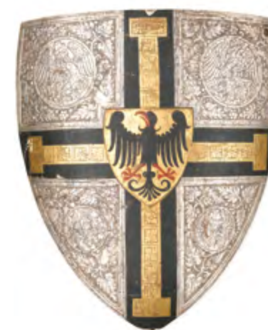
Ryc. 16 Tarcza trójkątna z herbem wielkiego mistrza – awers, fot. Łukasz Gałecki