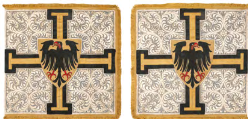
Ryc. 1 Sztandar z herbem wielkiego mistrza – awers, fot. Lech Okoński