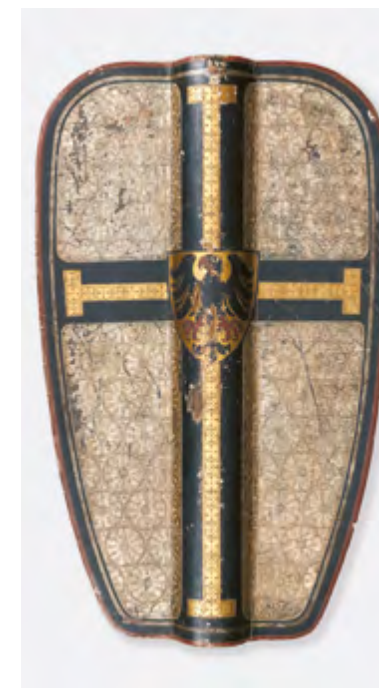
Ryc. 12 Pawęż z herbem wielkiego mistrza – awers, fot. Łukasz Gałdecki