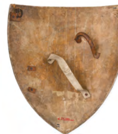
Ryc. 17 Tarcza trójkątna z herbem wielkiego mistrza – rewers, fot. Łukasz Gałecki