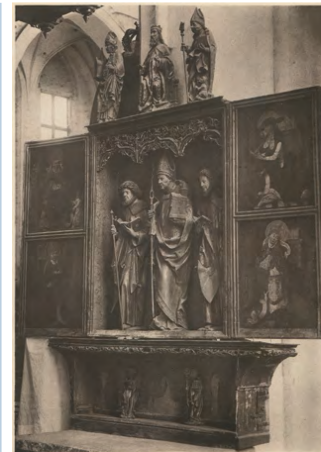
Ryc. 4 Tryptyk św. Wolfganga po konserwacji, fot. za: B. Schmid, Die Denkmalpflege in der Provinz Westpreußen im Jahre 1911 , Danzig 1912, Ryc. 6